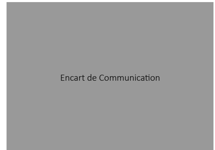
Encart de Communication

De plus en plus de salariés sont à la recherche d'un